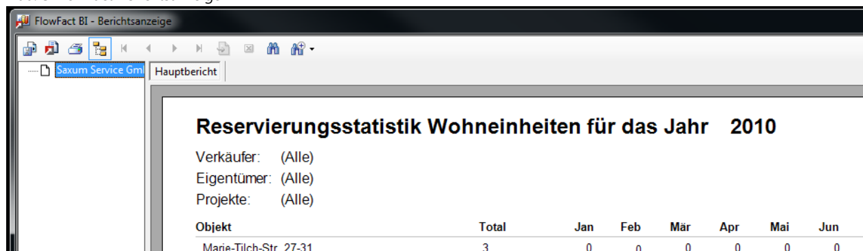
Abb. 3 FlowFact Berichtsanzeige

Der Bericht ist anhand der Eigentümer vorsortiert.